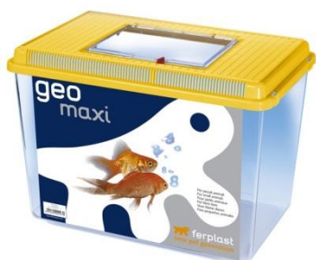
Fauna Box Aquazoo 5