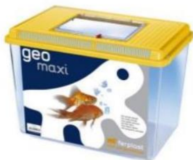
Fauna Box Aquazoo 5